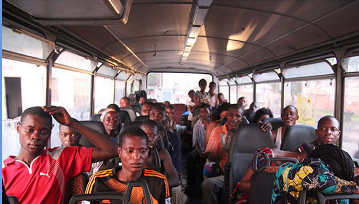
Transport des migrants